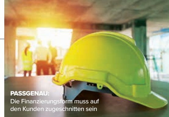
PASSGENAU: Die Finanzierungsform muss auf den Kunden zugeschnitten sein

Um die Stärken und Schwächen der Anbieter näher zu beleuchten, definierten die Fachleute fünf Fairness-Kategorien und ordneten ihnen die Attribute zu. Für jeden Bereich ermittelten sie anschließend eine Teilnote. Unter Berücksichtigung der